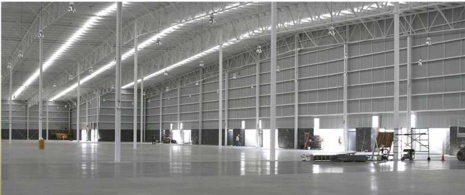
PARQUE INDUSTRIAL QUERETARO STA ROSA JAUREGUI, QRO. 12,000 m 2