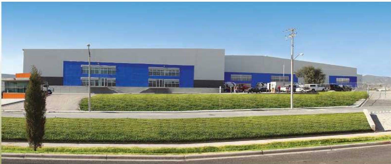
PARQUE INDUSTRIAL QUERETARO STA ROSA JAUREGUI, QRO.